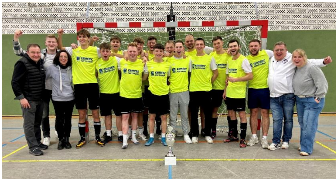
Erstmals Sieger beim Turnier der heimischen Vereine: E-Center Hartmann

Innenausbau - Treppen - Bauelemente in Holz, Kunststoff und Alu