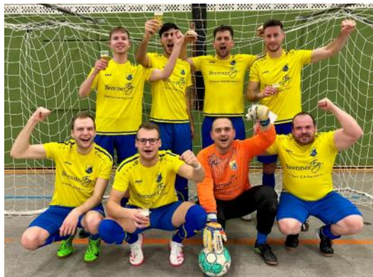
Sieger beim Turnier der Reservemannschaften: TuS Dielingen II

Den Auftakt machte wie gewohnt am Freitag das traditionelle Turnier für Reservemannschaften. Insgesamt 10 Mannschaften fanden sich bei bester Laune in der Halle ein und lieferten sich einen spannenden Schlagabtausch. Turniersieger wurde verdientermaßen der TuS Dielingen II.