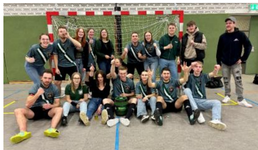
Erfolgreichstes Team an der Theke: Schützenverein Hollwede

Ein Novum gab es am Sonntag. Erstmals beim Turnier der heimischen Vereine und Thekemannschaften dabei war das Team vom E-Center Hartmann, welches direkt als Mitfavorit ins Rennen ging und sich letztendlich verdient den Titel sichern konnte. Seit einigen Jahren konnte das Turnier wieder mit acht Mannschaften im Modus Gruppenphase + K.O.-Runde ausgetragen werden. Die sehr gute Beteiligung trug wesentlich zur ausgelassenen Stimmung während des gesamten Tages bei.