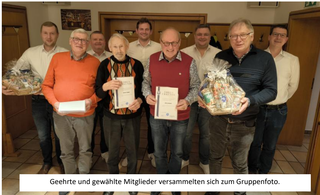
Geehrte und gewählte Mitglieder versammelten sich zum Gruppenfoto.